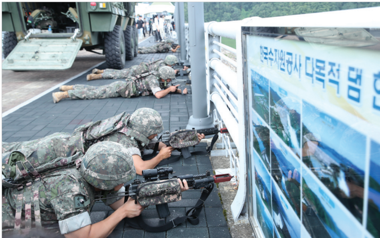
수자원공사, 대청댐서 테러대응 실제훈련 한국수자원공사가 대청댐서 테러대응 실제훈련을 했다. 공사는 22일 대청댐을 대상으로 댐 수문파손 상황 발생을 가정한 훈련을 진행했으며 비상상황 시 관계기관 협력체계 점검 및 위기대응 역량 강화를 훈련의 목적으로 했다. 이날 훈련은 현실감과 긴장감있는 연출을 통해 대처역량을 높이기 위해 작전용 헬기와 장갑차, 보트, 긴급복구설비 크레인, 급구차, 소방차 등이 동원됐다.

한국조폐공사가 국립중앙박물관에 소장 중인 옛 국보 반가사유상을 카드형 골드(사진)로 제작한다. 반가사유상 기념메달은 국립중앙박물관과 협업해 우리나라 대표 유물의 우수성을 알리기 위해 기획됐다. 이번 카드형 골드 앞면에는 사선으로 바라본 반가사유상의 모습을 정밀하게 표현해 예술성 높게 표현했다. 뒷면에는 조폐공사 홀마크와 위변조 방지 특허기술인 잠상을 적용해 품질을 보충했다. 카드형 골드는 78호 2종, 83호 2종 등 총 4종으로 출시되며 조폐공사 소평물 및 조폐공사 오토·디옴관 등에서 상시 판매한다. 반장식 사장은 "앞으로도 예술성 높은 문화유산을 주제로 다양한 형태의 기념메달을 꾸준히 선보여 국민들의 문화향유권을 높여겠다"고 말했다. 한은혜 기자 eunhye7077@dailycn.net